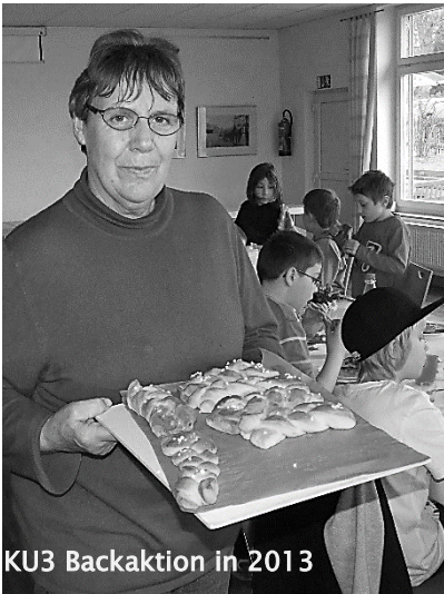
KU3 Backaktion in 2013